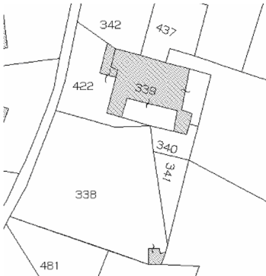
Stralcio di mappa catastale